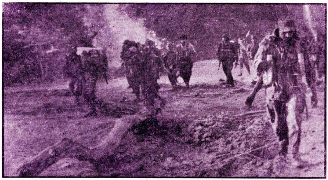
மன்னிலொரு பிடியெளிவாக அள்ளவரும் கைதறிக்கக் காத்திருக்கும் தமிழர்சேனை.

சிங்களப்படையைப் பொறுத்த வகையில், ஜயசிக்குறியும், ஒரு நீண்ட இராணுவப்பயணம் இற்தப்பயணத்தில் அது பேரிழப்புகளையும் - பெரும் நெருக்கடிகளையும் இதுவரை சந்தித்துள்ளது. அரைப்பங்கைக் கூட எட்டாத நிலையில், ஜயசிக்குறியும் படை சந்தித்த இந்த இழப்பு, எதிர்காலத்தில் அது சந்திக்க இருக்கும் அணர்த்தத்தை எடுத்துக் கூறப்போதுமானது. O