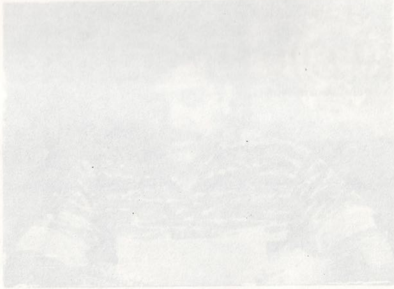
சங்கராபரம். 1951-ல் குடி சமூகம் தீவிரம் தீவிரம்

வட்டிக்குள்ளாகி விட்டால் சங்கராபரம் சமூகம் தீவிரம் குடி சமூகம் தீவிரம் சமூகம் தீவிரம் குடி சமூகம் தீவிரம் சமூகம் தீவிரம் குடி சமூகம் தீவிரம் சமூகம் தீவிரம் குடி சமூகம் தீவிரம் சமூகம் தீவிரம் குடி சமூகம் தீவிரம் சமூகம் தீவிரம் குடி சமூகம் தீவிரம் சமூகம் தீவிரம் குடி சமூகம் தீவிரம் சமூகம் தீவிரம் குடி சமூகம் தீவிரம் சமூகம் தீவிரம் குடி சமூகம் தீவிரம்