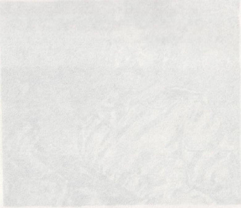
விடுதலைப் புலிகளின் தோற்றமானது எழுபதுகளில் தலைவர் பிரபாகரன்.

விடுதலைப் புலிகளின் தோற்றமானது எழுபதுகளில் தலைவர் பிரபாகரன். விடுதலைப் புலிகளின் தோற்றமானது எழுபதுகளில் தலைவர் பிரபாகரன். விடுதலைப் புலிகளின் தோற்றமானது எழுபதுகளில் தலைவர் பிரபாகரன். விடுதலைப் புலிகளின் தோற்றமானது எழுபதுகளில் தலைவர் பிரபாகரன்.