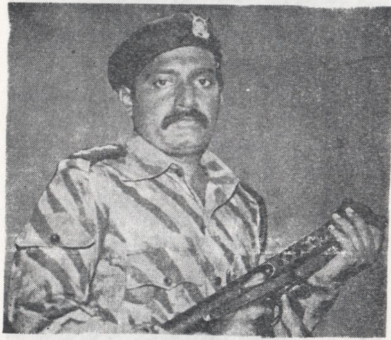
எண்பதுகளில் தலைவர் பிரபாகரன்

வட்டிக்குள்ளாகி விட்டால் சங்கராபரம் சமூகம் தீவிரம் குடி சமூகம் தீவிரம் சமூகம் தீவிரம் குடி சமூகம் தீவிரம் சமூகம் தீவிரம் குடி சமூகம் தீவிரம் சமூகம் தீவிரம் குடி சமூகம் தீவிரம் சமூகம் தீவிரம் குடி சமூகம் தீவிரம் சமூகம் தீவிரம் குடி சமூகம் தீவிரம் சமூகம் தீவிரம் குடி சமூகம் தீவிரம் சமூகம் தீவிரம் குடி சமூகம் தீவிரம் சமூகம் தீவிரம் குடி சமூகம் தீவிரம்