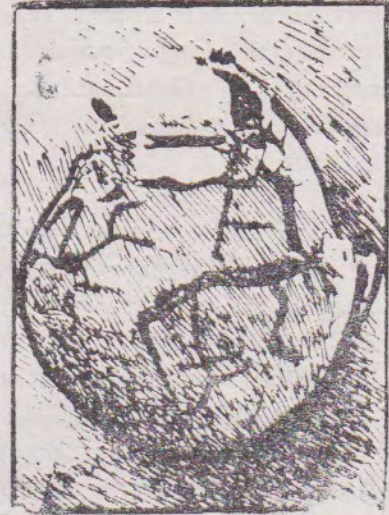
பொம்பரிப்பில் காணப்பட்ட ஈமத்தாழி.

மேற்கூறிய தொல்லியற் சான்றுகள் தென்னிந்தியாவிற் காணப்படும் இதே பண்பாட்டுக்குரிய தொல்லியற் சான்றுகளை ஒத்துக் காணப்படுகின்றன. இவற்றைத் தான் தமிழ்மொழியிலுள்ள சங்க இலக்கியங்களும் எடுத்துரைக்கின்றன. இப்பண்பாடு தென்னிந்தியாவிலே கி மு. 1000 ஆண்டுக்கு முன்னரே வளர்ச்சியடைந்து இலங்கையிலும் பரவியிருந்ததை இச்சான்றுகள் உறுதி செய்வதால், பாளி நூல்கள்கூறும் கி.மு 500இற்குப் பின்னர் வந்த விஜயனும் அவனது ஆட்களும் வட இந்தியாவிலிருந்தே ஈழத்துக்கு நாகரிகத்தையும் பண்பாட்டையும் கொண்டுவந்தனர் என்பது ஒரு கட்டுக்கதை என்பது உறுதியாகியுள்ளது. அதனுடன் பொம்பரிப்பு, மாந்தை போன்ற இடங்களிலே கிடைத்த எலும்புக்கூடுகளை ஆராய்ந்த அறிஞர் இலங்கையின் பெருங்கற்காலப் பண்பாட்டுக்கு உரியவர்கள்