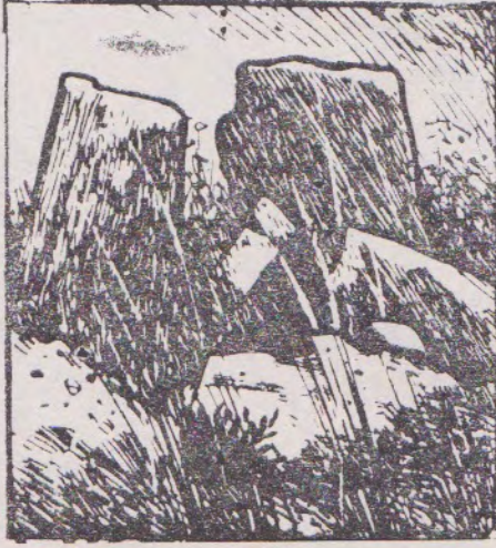
மட்டக்களப்பு கதிரவெளியில் காணப்பட்ட கல்மேசை

இதனால் இலங்கையில் இன்று தமிழ் - சிங்கள மொழிகளைப் பேசுவோர் பெருங்கற்காலப் பண்பாட்டின் வழிவந்தவர்களே என்பது தெளிவாகின்றது. சிங்களமொழியின் மூதாயத மொழியாகிய எலு, பௌத்தத்துடன் வந்த பாளி மொழியின் செல்வாக்காலே தற்காலச் சிங்கள மொழியாக உருமாறியது போன்று தமிழ்மொழி உருமாறவில்லை. பௌத்தம், சிங்கள - தமிழ் மொழி பேசுவோரின் பண்பாடு கூர்மையடைய வழிவகுத்தாலுங்கூட, இன்றும் சிங்கள தமிழ் மொழிகளுக்கிடையே காணப்படும் மொழியியல் ஒற்றுமைகள், பிற பண்பாட்டு ஒற்றுமைகள் ஆகியவை, பௌத்தம் இந்நாட்டிற்குள் புகமுன்னர் இம்மக்கள் பண்பாட்டு அடிப்படையில் ஒன்றாகக் காணப்பட்டனர் என்பதை எடுத்துக்காட்டுகின்றன.