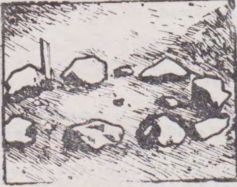
வவுனியா மாமடுவில் காணப்பட்ட கல்வட்டம்

பத்தி) மந்தை வளர்ப்பு, கறுப்பு, சிவப்பு நிறங்களிலான மட்கலங்கள் ஆக்குதல் ஆகியவை இதன் சிறப்பியல்புகளாக விளங்கின. இதனால் இப் பண்பாட்டில் மக்களின் வாழ்விடங்கள், ஈமத் தாழிகள், கல்லறைகள், குளங்கள், வயல்கள் ஆகியன முதன்மை பெற்றன. மக்களின் வாழ்விடங்களான கந்த ரோடை, அனுராதபுரம், மாந்தை, திஸ்ஸமகாராம ஆகிய இடங்களில் மேற்கொள்ளப்பட்ட அகழ்வாய்வுகள் இப்பண்பாட்டின் ஒருமைப்பாட்டினை உறுதிசெய்துள்ளன. ஈமப் பொருட்கள்கூடப் பல வகைப்படும். தாழிகள் கற்றிட்டைகள், கல்மேசைகள், கல்வட்டங்கள், நீளக்கிடத்தி அடக்கம் செய்வதற்கான பொருட்கள் என்பன இவற்றுட் சிலவாகும். புத்தளம்