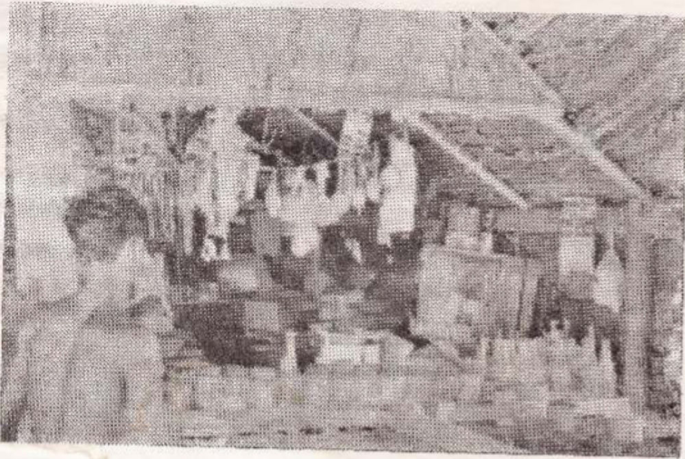
வருமானத்துக்கான சிறுவியாபார முயற்சி பண்டிதர் குடியிருப்பு.